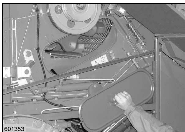
شکل ۱- فاصله بین کوبنده و ضد کوبنده

استفاده و تأثیر سه تیمار سرعت دورانی کوبنده در چهار سطح ۷۰۰، ۸۰۰، ۹۰۰ و ۱۰۰۰ دور در دقیقه، فاصله بین کوبنده و ضدکوبنده در چهار سطح ۸، ۱۰، ۱۲ و ۱۴