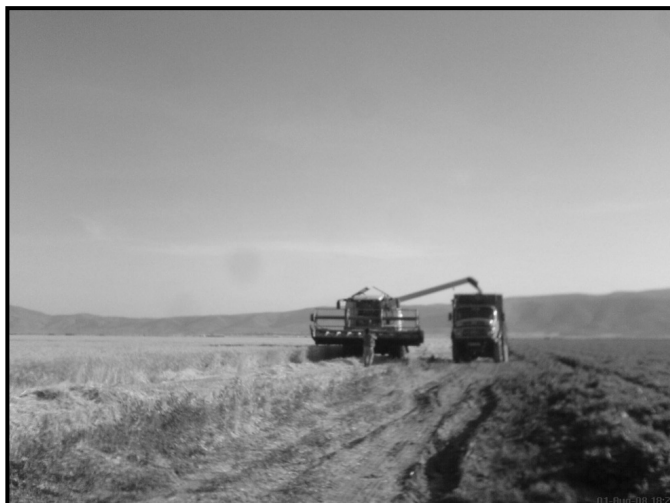
شکل ۲- تخلیه داخل کامیون.